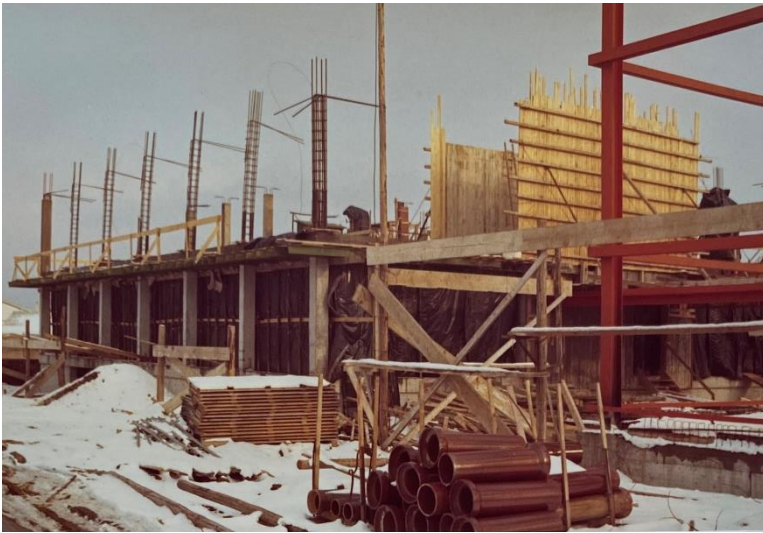
Foto: Der Bau der Firmenzentrale in Maichingen erfolgte in den 1960er Jahren.