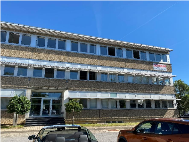
Foto: Der Firmensitz der Göhrum Fahrzeugteile GmbH in Maichingen.

Die Göhrum Fahrzeugteile GmbH sitzt in der Ulmenstraße 17 in Sindelfingen-Maichingen. Weitere Informationen zum Unternehmen sind auf www.goehrum.de zu finden.