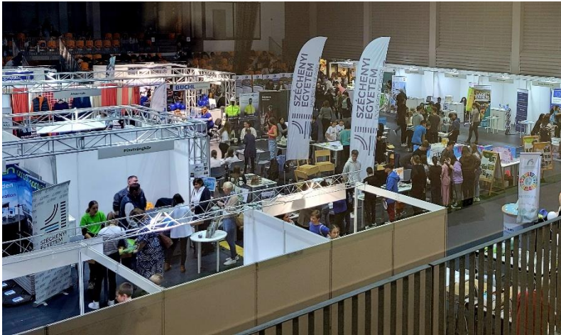
Foto: Die Klima Expo in Győr lockte zahlreiche Besucherinnen und Besucher an.

Die Klima Expo in Győr, die zum vierten Mal stattfand, brachte vielfältige Aussteller zusammen, darunter neben den Partnerstädten auch Unternehmen aus den Bereichen Mobilität und Nachhaltigkeit, die Universität von Győr sowie weitere Bildungseinrichtungen und Nichtregierungsorganisationen. Győr ist seit 1989 Partnerstadt von Sindelfingen. Die Stadt mit rund 130.000 Einwohnern liegt westlich von Budapest und ist das zweitgrößte Industrie- und Handelszentrum Ungarns.