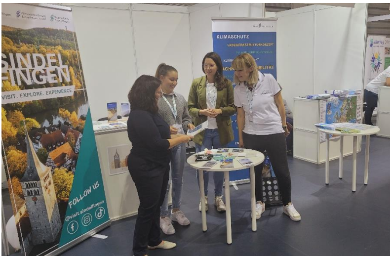
Foto: Vertreterinnen der WSG mit Messe-Besucherinnen am Stand der Stadt Sindelfingen.